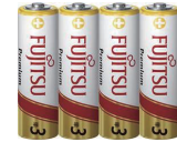
アルカリ乾電池「プレミアムシリーズ」

災害時、特に必要になる乾電池。防災備蓄用として、なんと10年間の長期保存も可能な富士通アルカリ乾電池をプレゼント。*